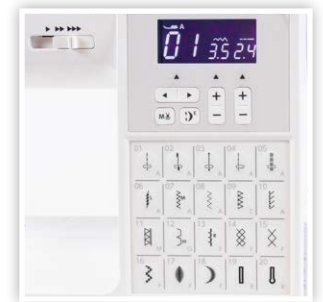
80 POINTS ESSENTIELS POUR LE PIQUAGE ET LA COUTURE