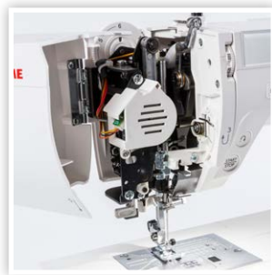
CONSTRUCTION SOLIDE POUR COUDRE À HAUTE VITESSE