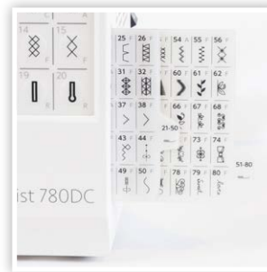
TABLEAUX DES POINTS POUR RÉFÉRENCE RAPIDE